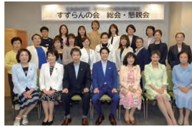
▲女性議員の親睦会に出席