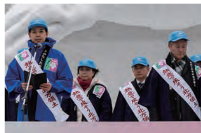
▲北方領土フェスティバルに参加