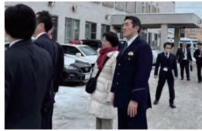
▲老朽化する警察署庁舎を視察