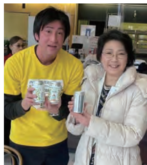
▲西岡地ビール1周年イベント