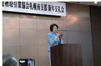
▲関係団体の新年会に出席