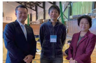
▲石狩南高校で総合学習の授業参観