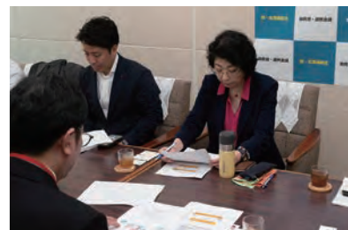
▲子供の死因究明に関する勉強会