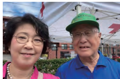
▲鉄一が里とよひらふれあいまつり