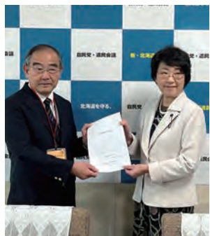
▲団体政策懇談会で要望を受ける