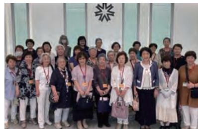
▲日赤月寒分団の皆さまが議会見学