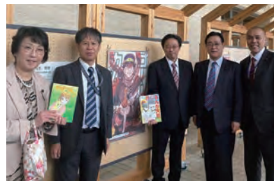
▲北海道ゆかりの漫画家パネル展