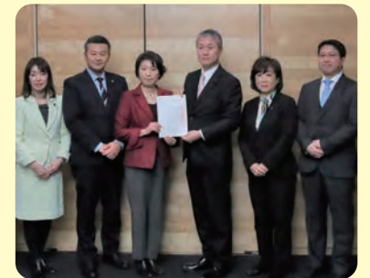
2月7日、超党派の検討会議が条例案を提出▲