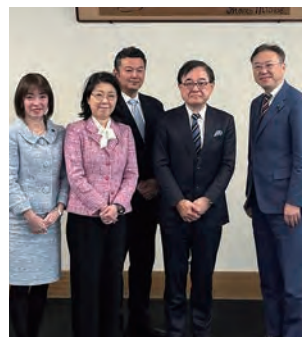
▲北大の寶金総長と懇談