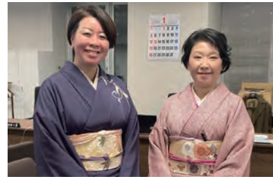
▲新年の初議会に着物で登庁