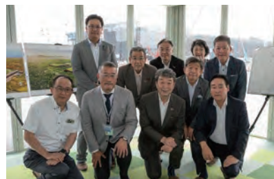
▲ラピダス工場建設現場を視察