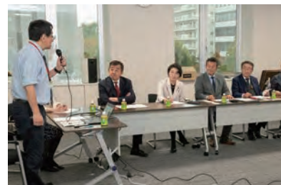
▲災害時の医療体制について学ぶ