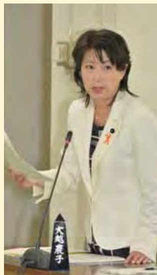
委員会でもいつも全力投球