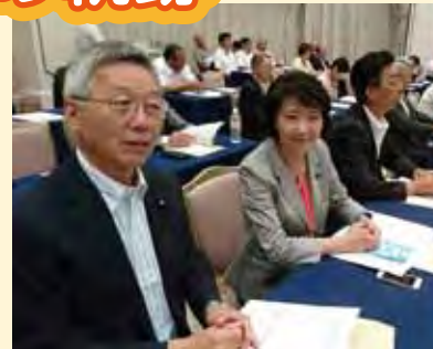
林業活性化議連総会に出席