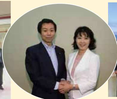
高木宏寿衆議院議員ともしっかりと連携