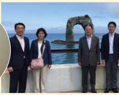
奥尻島の経済状況を視察