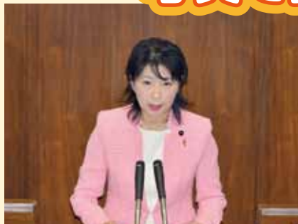
道議会本会議一般質問で堂々と質問