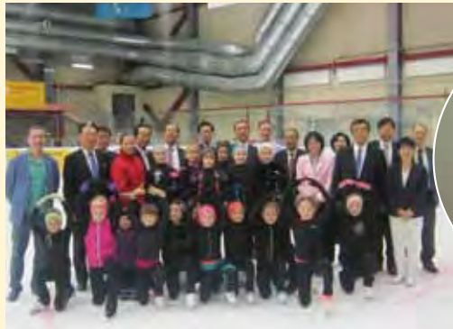
ロシアとの交流促進にも尽力