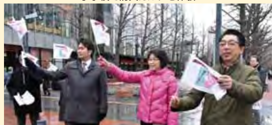
道民の悲願である北方領土の早期返還を訴える