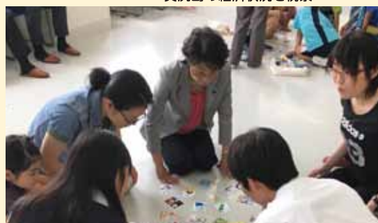
小学校で防災カルタを体験