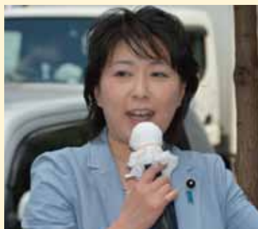
街頭で市民の皆さんに道政報告